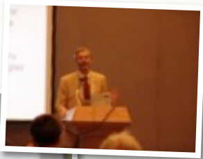
Bei zwei meiner Vortragsveranstaltungen.