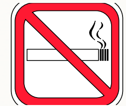
Ohne Rauchen wird man schneller gesund.