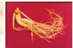
Ginseng und andere Pflanzen helfen heilen.