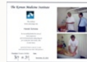
Mein Diplom über koreanische Sa-am Akupunktur.