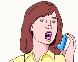
Inhalationstherapie hilft bei vielen Erkrankungen.